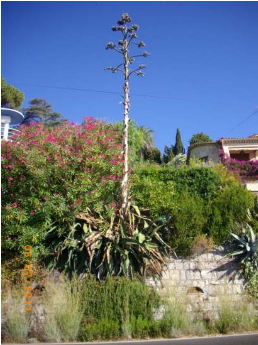
Très beau spécimen de cactus avec sa fleur