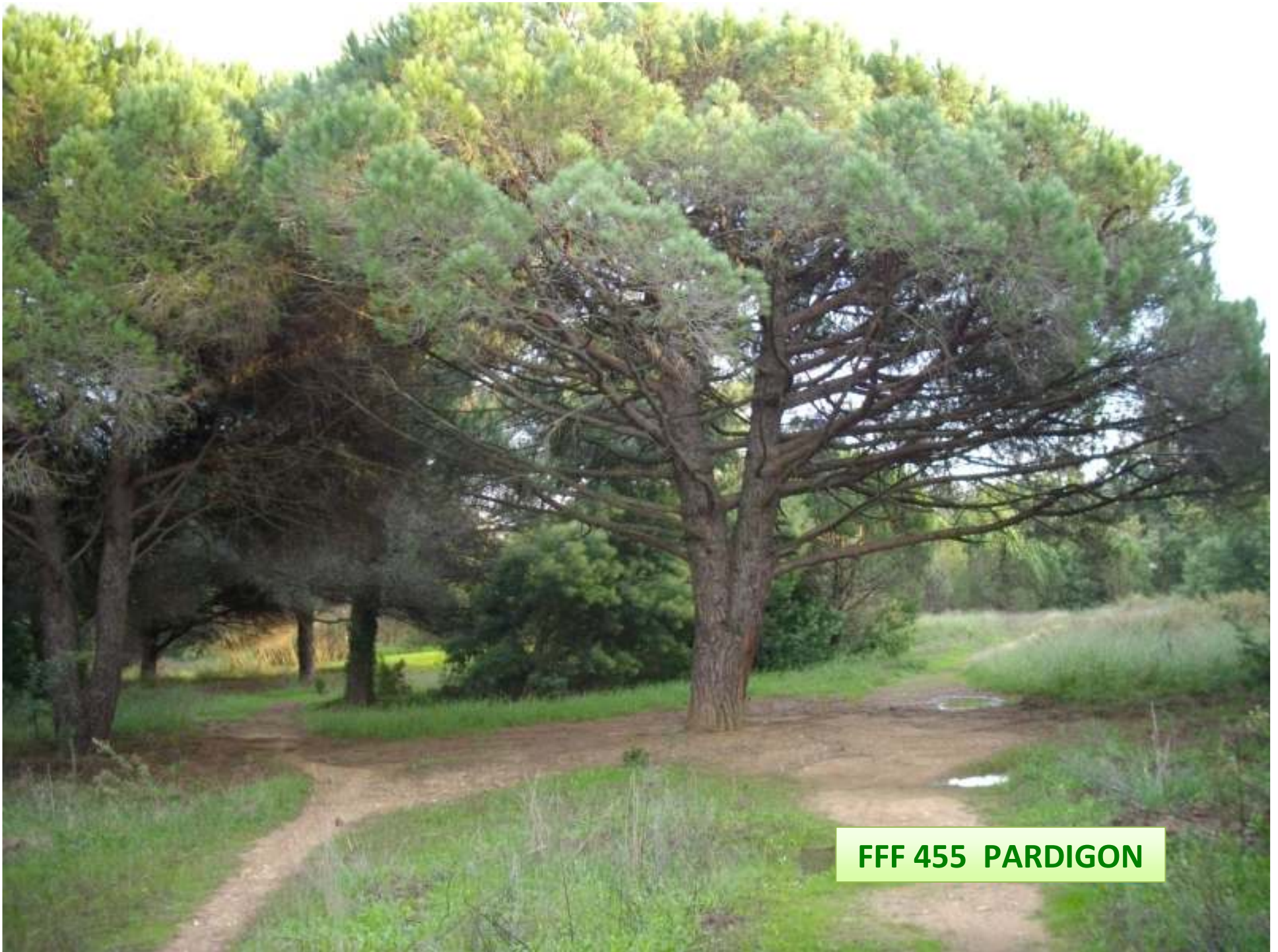
FFF 455 PARDIGON