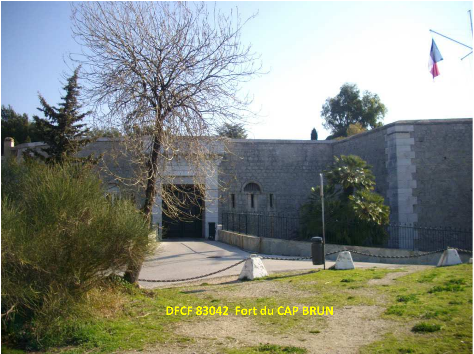
DFCF 83042 Fort du CAP BRUN